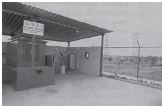
Figura 3. Planta piloto en Santa Cruz Meyehualco, D.F., 1991.

biogás. En cinco de los sitios estudiados se identificó un potencial de 26 MW, con costos de generación entre 2 y 3 centavos de dólar por kWh.